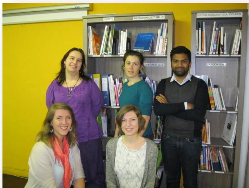
L'équipe salariée de l'association Tous Bénévoles en 2015