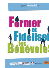
Former et Fidéliser les Bénévoles (9€)

La réalisation de ces ouvrages, pilotée par Programme AlphaB, est issue du travail collectif d'associations de terrain. Ces guides sont destinés à outiller les associations et les bénévoles.