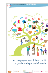
Accompagnement à la scolarité. Le guide pratique du bénévole (15€)

Commandez nos guides sur guides@espacebenevolat.org Un exemplaire offert aux adhérents