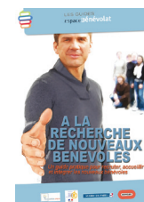
A la Recherche de Nouveaux Bénévoles (15€)