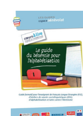
Le Guide du Bénévole pour l'Alphabétisation (12€)