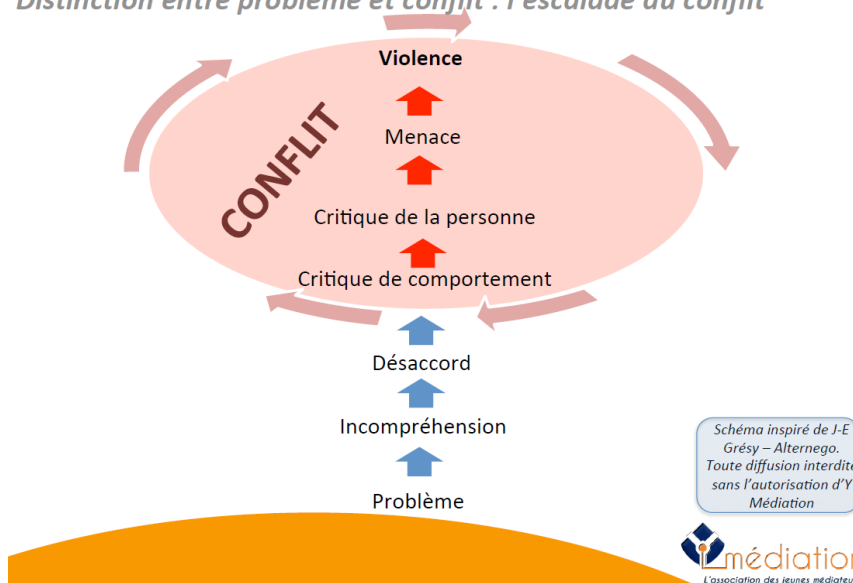
Schéma inspiré de J-E Grésy - Alternego. Toute diffusion interdite sans l'autorisation d'Y Médiation

Distinction entre problème et conflit : l'escalade du conflit